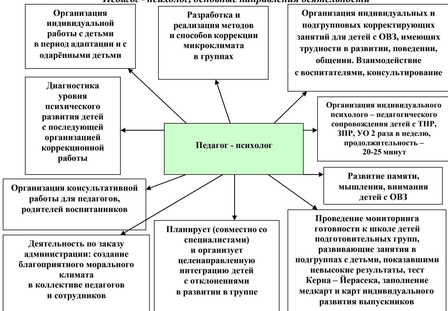
Рис. 2 «Педагог - психолог, основные направления деятельности»